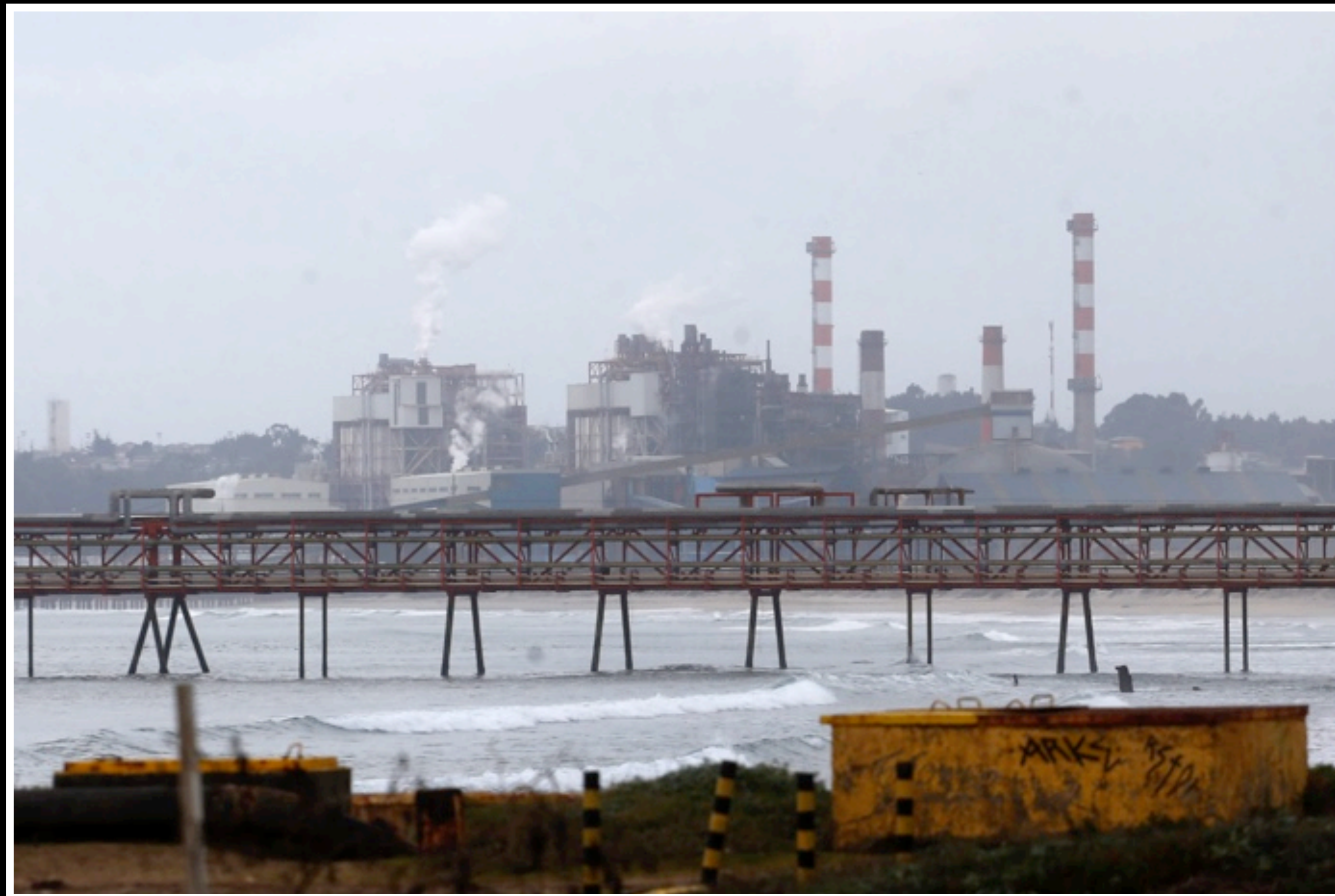
Empresa AES Gener, baía de Quintero-Puchancavi, Chile